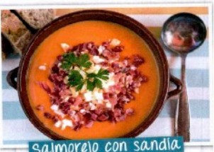
salmorejo con sandia

lla y limón. Era una motivación preparar la comida. Le dedicaba mucho más tiempo. Aunque era más chef que cocinero (risas). ¿Qué se puede esperar de Reiniciando? Desconectar de sus problemas. La gente se va a reír y va a recordar a esta pandemia, a veces con nostalgia, otras con tristeza y, unas pocas más, con muchas risas por esas situaciones tan desparatadas que se sufieren. Si tuvieras que describir a Valeria, Lucas y Santi, los protagonistas de Reiniciando, ¿con qué platos, primero, segundo y postre, los definirías? A Valeria, de primero, la crema de calabazo que le sale estupenda, aunque suele comprarlas de bote. De segundo, unas verduras a la plancha con un poco de pollo, aunque más bien se queda solo en la tienda de pollos de al lado de su casa... Y de postre, un buen trozo de bizcocho de chocolate, que hay una pastelería buenísima en su barrio. A Lucas, unas patatas fritas con sus correspondientes aceitunas de aperitivo. De primer plato, las lentejas de Santi, que no hay quien las prepare